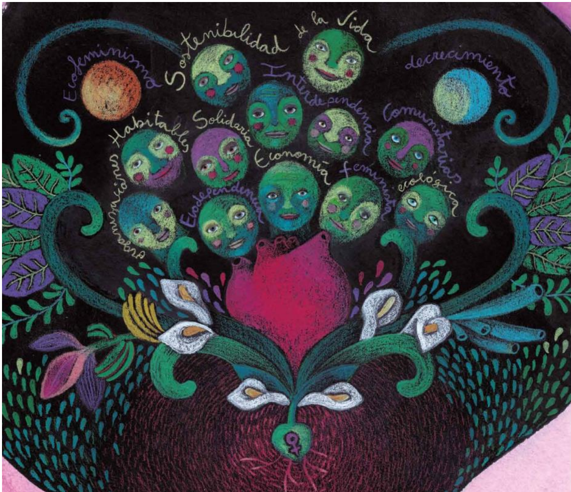
Ilustración de la publicación Diccionario Feminista. REAS Euskadi.